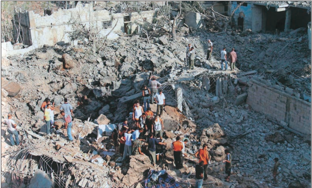
القصف على مخيم عين الحلوة