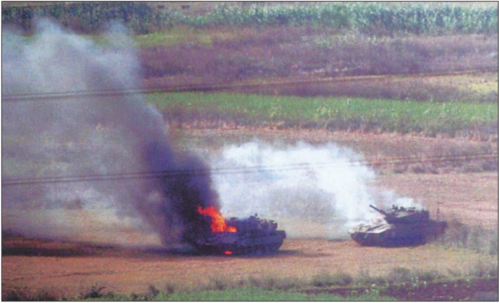
مجزرة الميركاغا قرب مرجعيون