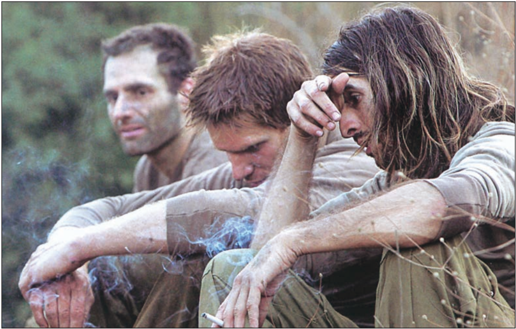
[وجه الهزيمة] (أ ف ب)