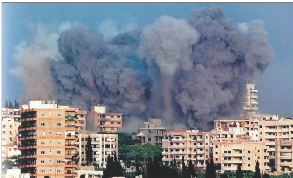
القصف على صور