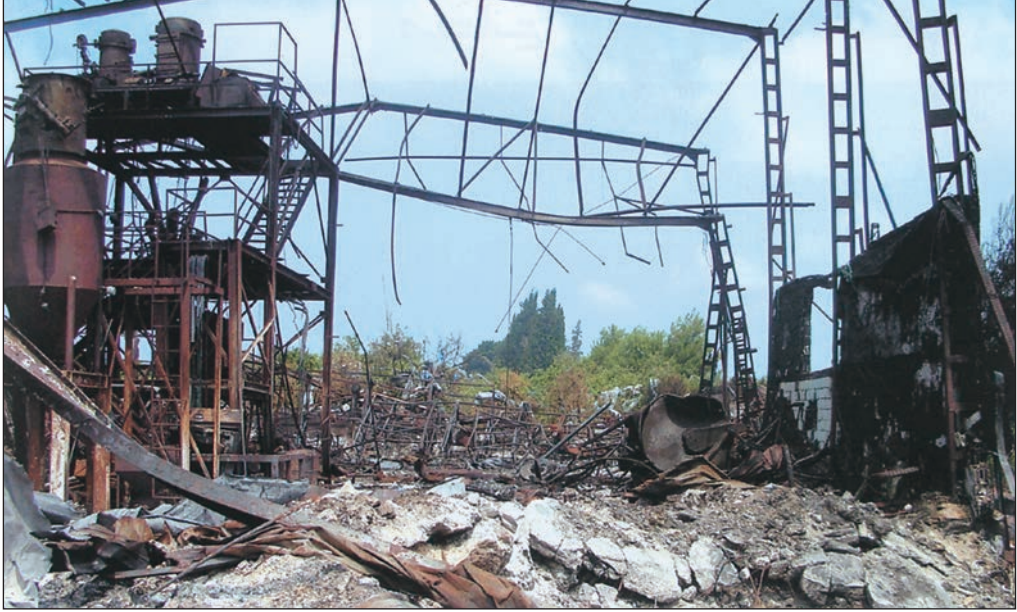
مصنع الأمصال الطبية في صور