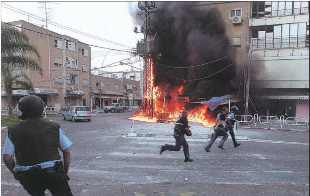
إسرائيليون يحتمون من صواريخ المقاومة على نهاريّا