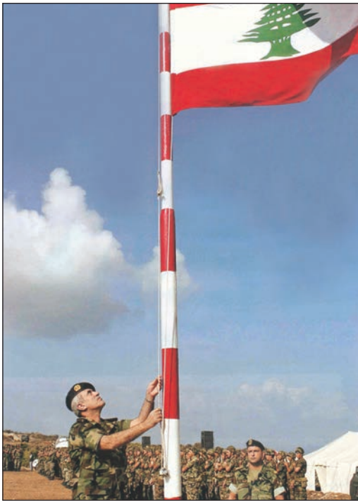
قائد الجيش العماد ميشال سليمان يرفع العلم اللبناني في تلة اللبونة في أقرب نقطة من الحدود