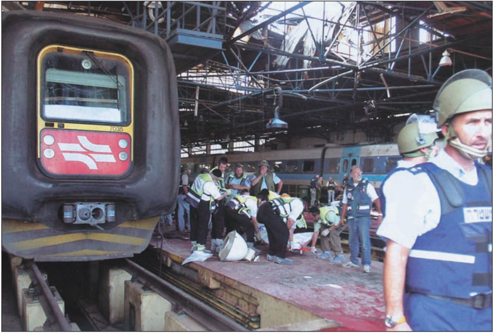
محطة القطار في حيفا التي اخترقتها صواريخ المقاومة