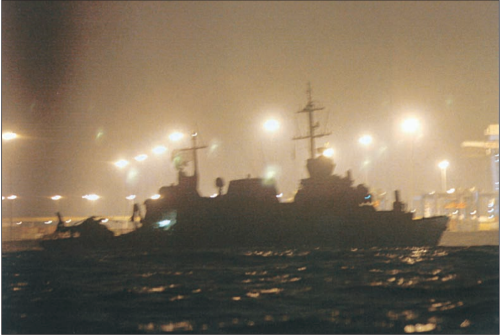
البارجة الإسرائيلية «حانيت» التي دمرتها المقاومة قبالة بيروت